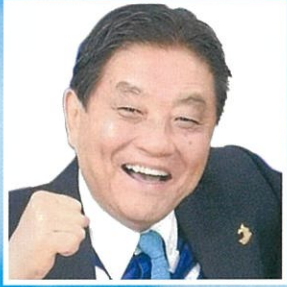
共同代表 河村たかし (名古屋市長)

日本がいま内外から壊されようとしています。 愛する日本を守りたい、 私たちはそのために立ち上がりました！