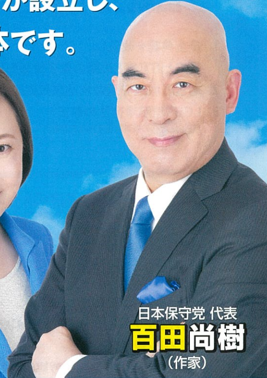
日本保守党 代表 百田尚樹 (作家)