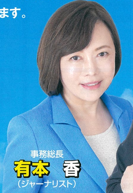
事務総長 有本 香 (ジャーナリスト)