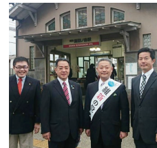
12月再選を果たした馬場衆議院議員と