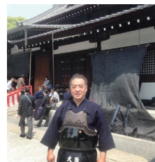
剣道京都大会参加現役で頑張っています