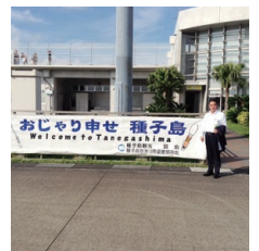
友好都市の種子島へ鉄砲祭りに参加