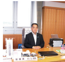
副議長室で執務を行う