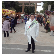
平成27年元旦寒風の中大鳥大社で新年のごあいさつ