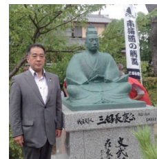
天下人 三好長慶公座像除幕式（南宗寺）