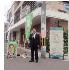
諏訪ノ森駅前にて朝の街宣活動