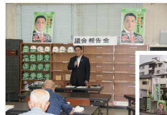
議会報告会を定期的に行っています（三光会館等）