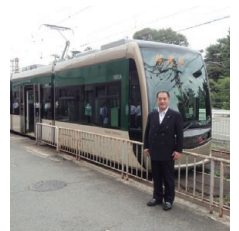
阪堺線、堺トラム、議会で初めて導入を要望しました