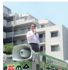
街宣活動で市民の皆様に熱く訴える